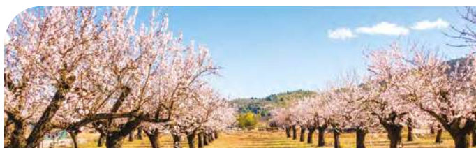
Amandiers en Fleurs

LE PRIX COMPREND : le transport en autocar ; le déjeuner croisière (menu sous réserve de modification) ; l'entrée aux bassins des lumières (programmation sous réserve de confirmation).