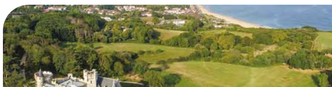
Le château d'Abbadia et Saint Jean de Luz