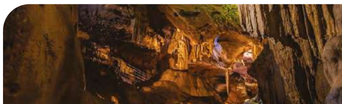
Grottes de Bétharram