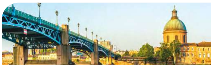
Toulouse, la ville rose